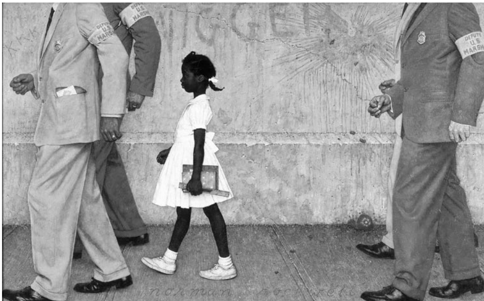
Norman Rockwell: A probléma, amellyel mindnyájan együtt élünk.

„Az az indulat legyen bennetek, mely volt a Krisztus Jézusban is.”