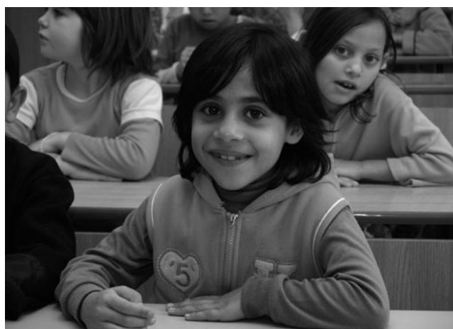
Általános iskolásaink a MÁV-telepen