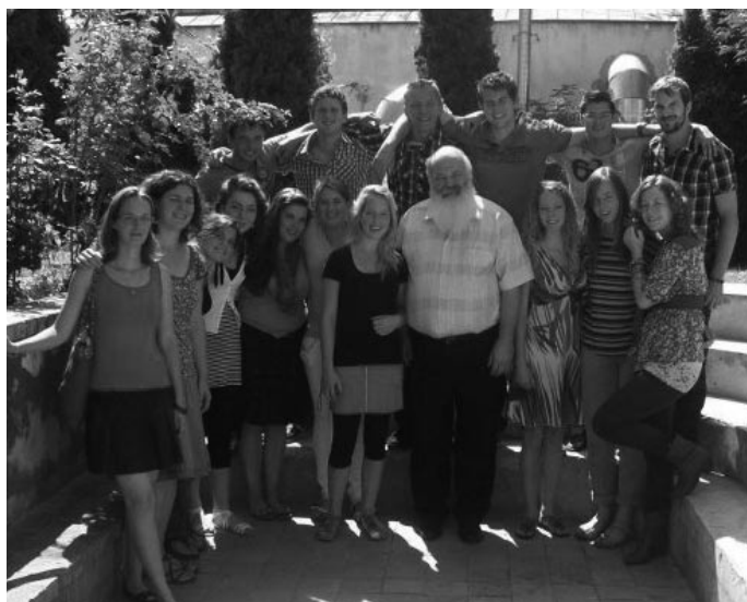
Holland önkéntesek csoportja Budapesten

Ma, augusztus utolsó napjaiban azzal indulunk neki a 2012/13-as tanévnek, hogy az oktatási kormányzat semmiféle hivatalos kapcsolatot nem vett fel velünk, hogy az állam nemcsak egyházi státuszunktól fosztott meg, de még egyesületként sem siet legalizálni minket, s ezért a különféle oktatási hivatalok azzal fenyegetnek bennünket,