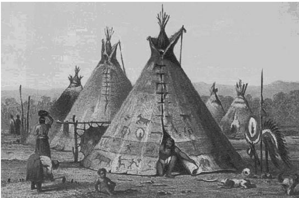
Kajova indián tábor