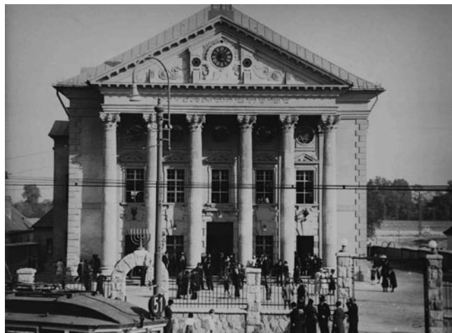
Óbudai zsinagóga az 1920-as években