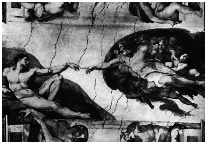
Michelangelo: Ádám teremtése (Sixtus-kápolna)

A Biblia két teremtéstörténetet tartalmaz. Az elsőben a világmindenségnek, mint egésznek a megteremtéséről van szó, ahol Isten logikusan, egymásra épülő szakaszokban teremt meg a káoszból a mindensé-