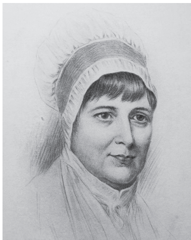
Elizabeth Fry.

Amikor munkája kiteljesedett, iskolát alapított szegény gyermekeknek. Ez az a korszak, amikor a társadalom elitje