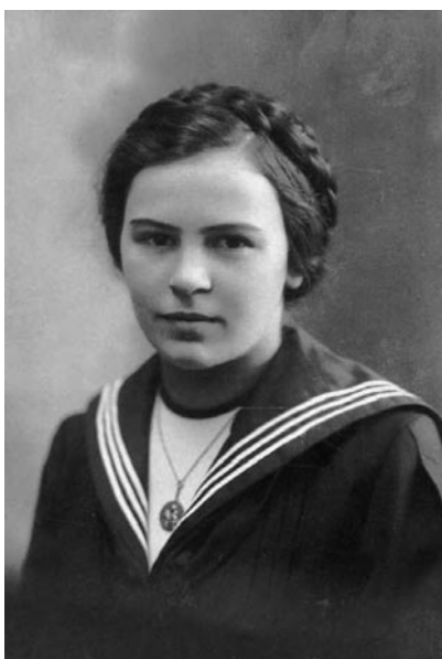
Salkaházi Sára

1927-ben megismerkedett a Kassán letelepedő szociális testvérekkel. 1 1928-ban elvégezte az általuk szervezett szociális és népjóléti tanfolyamot, majd „háztűznézőbe” ment a budapesti anyaházba. Sára