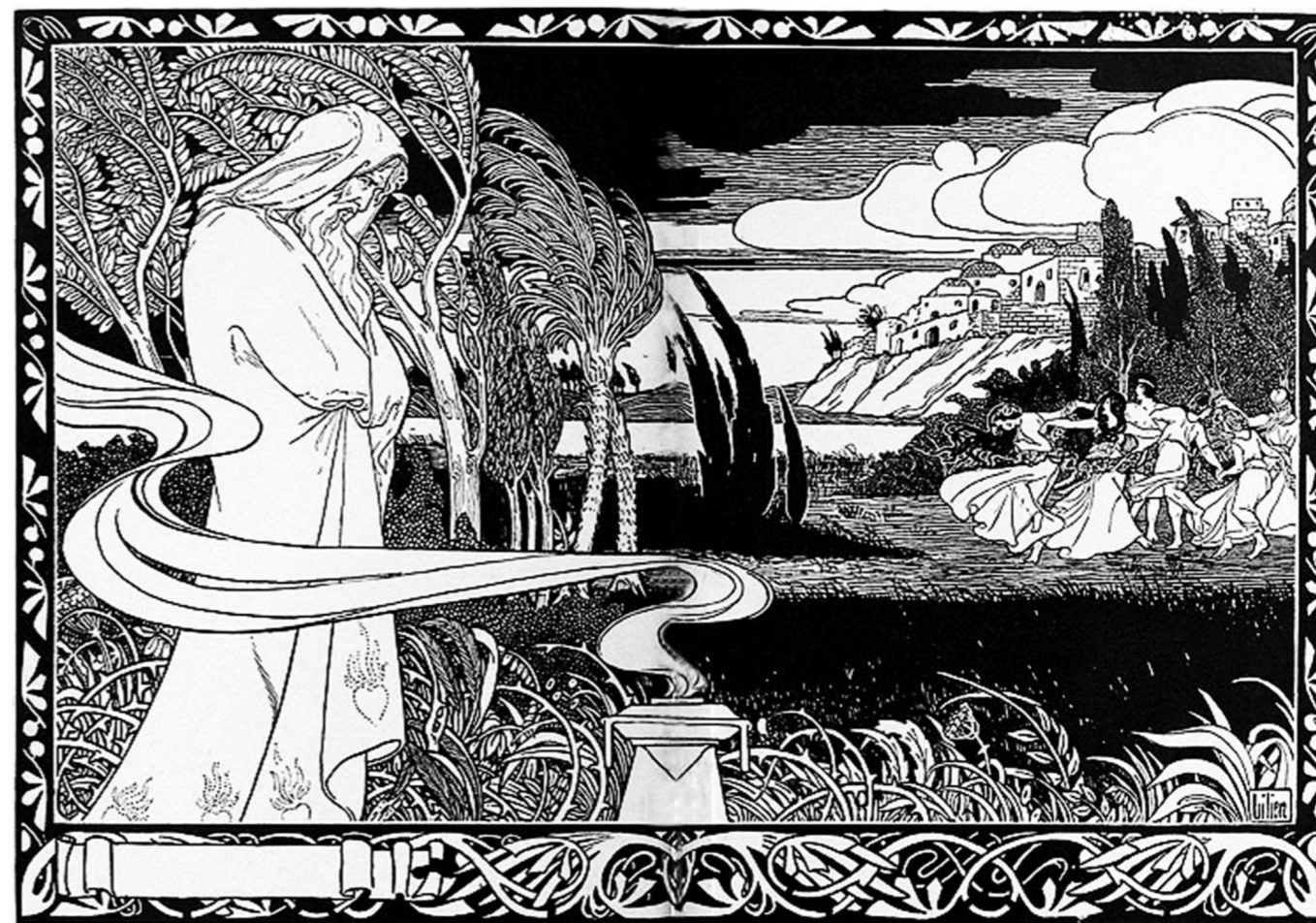
Ephraim Moshe Lilien: Jesaja (A kép forrása: wikimedia.org)

„Ekkor megszólaltam: Jaj nekem! Elvesztem, mert tisztátalan ajkú vagyok, és tisztátalan ajkú nép között lakom. Hiszen a Királyt, a Seregek Urát látták szemeim! Ekkor odarepült hozzám egy szeráf, kezében parázs volt, amelyet fogóval vett le az oltárról. Számhoz érintette, és ezt mondta: Íme, ez megérintette ajkadat, bűnöd el van véve, vétkeid meg van bocsátva. Majd az Úr szavát hallottam, amint ezt kérdezi: Kit küldjek el, ki lesz a követőnk? Én ezt mondtam: Itt vagyok, engem küldj!”