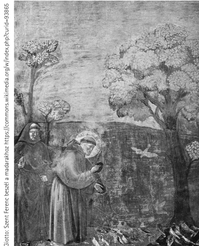
Giotta: Szent Ferenc beszél a madarakhoz https://commons.wikimedia.org/w/index.php?curid=93865

A középkori Európában a keresztény, vallásos élet fő központjai a szerzetesrendek voltak, melyek tagjai valamennyien egész életükre szóló – szüzességi, szegénységi és engedelmisségi – fogadalmat tettek, s ez elkülönítette őket az egyház más, „közönséges” tagjaitól. A középkor nagy, nyugati szerzetesi közösségei közül először Szent Benedek rendje, közkeletűbb néven a bencés rend alakult meg, majd ezt követte az ágostonrendi kanonokok szerzetesrendje. A legtöbb, később megalakult szerzetesrend általában a bencés vagy (például a ferences renddel egy időben, a XIII. században alakult domonkos rend) az ágostonos regulát vette át. Ez alól az egyik kivétel épp az Assisi Szent Ferenc által alapított ferences rend regulája, melyet maga Ferenc írt. Ferenc az elmúlt közel nyolc évszázadban az egyik legeslegnépszerűbb szent a világon. Idén, október 3-án van halálának 790. évfordulója. De mit is lehet róla tudni?