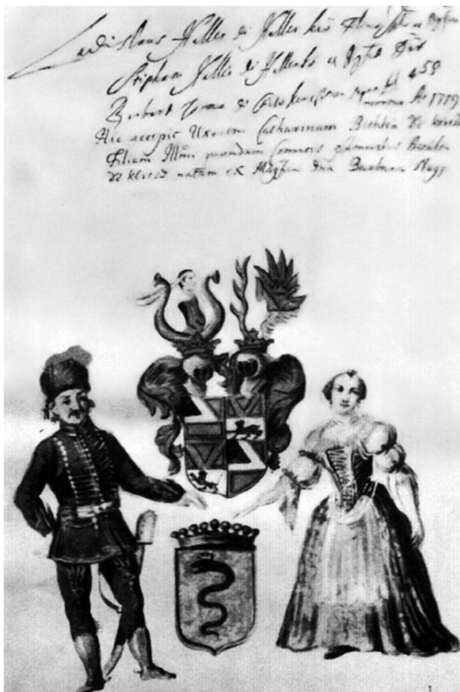
Bethlen Kata és első férje, Haller László a Haller család nemzetségtáblájában.

A család nélkül maradt asszony egyik legfontosabb támasza – erős protestáns hite mellett – az írás volt. 1744-ben kezdte el híres önéletírását, amit élete végéig folytatott. Bár a kézirat csonka maradt, és csak halála után, 1762-ben jelent meg Gróf Bethleni Bethlen Kata életének maga által való rövid leírása címmel. Engemet senki jobban és közelebről nem esmér, mint magam – írja, és ebből az önmegfigyelésből születik meg az az irodalmi lélekrajz, ami kora legfőbb művészi újdonságai közé tartozik. A műben a memoár és a napló keveredik egymással, szerkezetét töredezetté teszik a közbeiktatott dokumentumok és levelek.